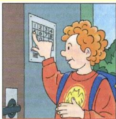
Пользуйтесь домофоном, чтобы вас встретили в подъезде