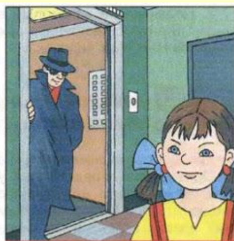
Не входите в лифт с незнакомыми людьми